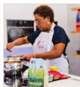
A Bom Sucesso vai tentar voltar a apoiar 'A Mesa dos Portugueses'