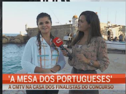
'A MESA DOS PORTUGUESES' A CMTV NA CASA DOS FINALISTAS DO CONCURSO