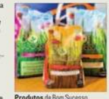
Produtos de Bom Sucesso

A Bom Sucesso é a marca do maior produtor de arroz em Portugal. Trata-se de uma marca que apenas tem arroz produzido na Lezíria Ribatejana e que também possui uma variedade por cada tipo de arroz. Durante o ano passado, o volume de negócios atingiu valores na ordem dos 20 milhões de euros.